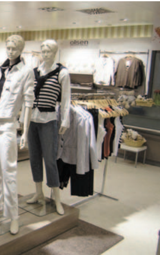
Breitere Gänge und ein übersichtliches Sortiment sind wichtige Ladenbauelemente. Oben: Modehaus Winkler in Bensheim.

und Hannover. Vor einem Jahr ist er deshalb mit dem Store-Konzept DeLu gestartet. DeLu sind Geschäfte, die sich mit den Kollektionen Delmod, Kim Kara, Lucia und Lecomte auf Best Ager-Kundinnen spezialisieren. Vor zwei Wochen feierte B & U Heutelbeck die vierte Eröffnung. Sechs neue Geschäfte sollen in diesem Jahr noch dazukommen.