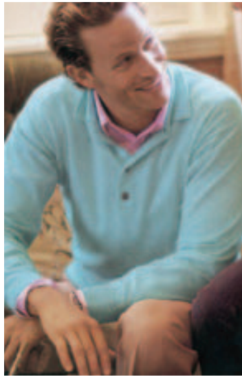
Der lang anhaltende Winter hat die Nachfrage nach Strick bis in den Frühling angekurbelt.