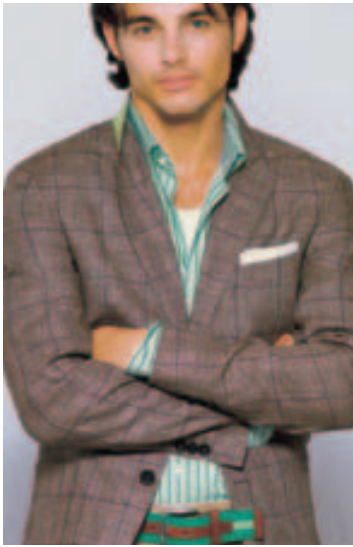
Männer haben das Sakko neu entdeckt. Vor allem der modisch interessierte, anspruchsvolle Kunde griff zu. René Lezard