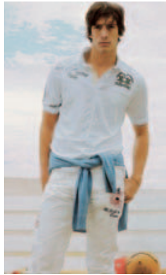
Das Polohemd war fester Bestandteil des sportiven Looks. Teamshirts waren besonders gefragt. La Martina