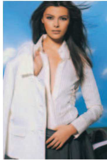
Indoorjacken waren weiterhin beliebt, allerdings weniger geschmückt als zuvor. Gabriele Strehle/Tepe-Katalog